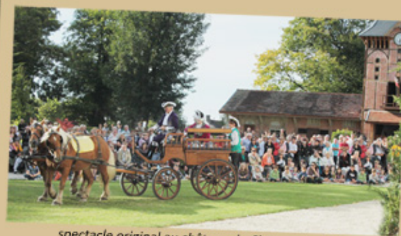
spectacle original au château de Charmont - 2012

Il sera notamment utilisé et mis en valeur lors de diverses manifestations culturelles telles que des spectacles historiques organisés lors des journées du patrimoine.